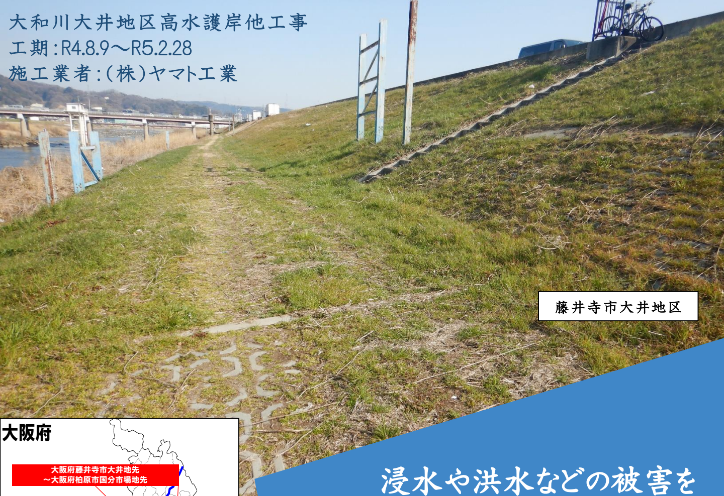
藤井寺市大井地区