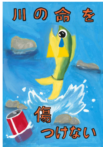
【ポスター部門】近畿地方整備局長賞

【問い合わせ先】 国土交通省 近畿地方整備局 大和川河川事務所 流域治水課 〒582-0009 大阪府柏原市大正2-10-8 TEL 072-971-1381(代表)