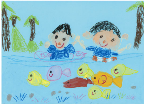
【絵画部門】大和川水環境協議会賞