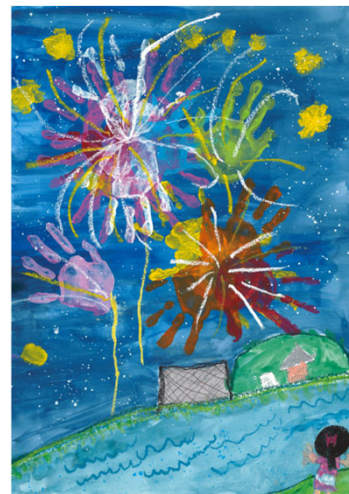
【絵画部門】近畿地方整備局長賞