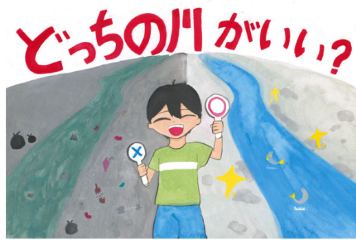
【ポスター部門】大和川水環境協議会賞