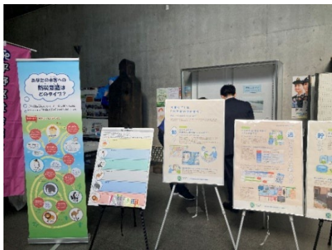
流域治水パネルと防災アニマル診断