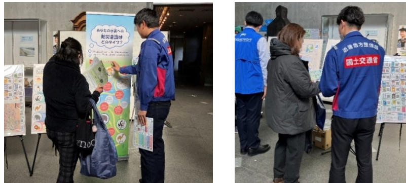
防災アニマル診断について説明