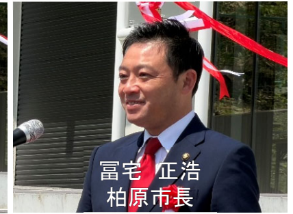
富宅 正浩 柏原市長