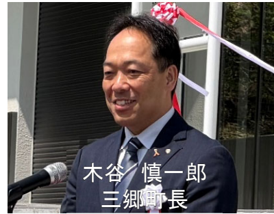
木谷 慎一郎 三郷町長