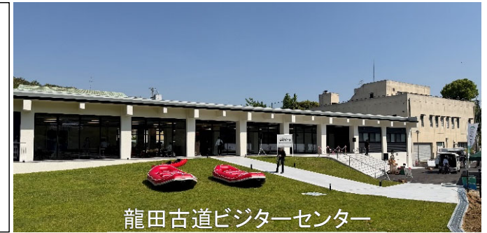
龍田古道ビジターセンター

○今後も引き続き「三郷町かわまちづくり」の活性化に向けて協力を図っていく他、インフラツーリズムの面においても、「亀の瀬地すべり歴史資料室」と連携した新たなガイドツアーの実施など、更なる地域の活性化に取り組んでいきます。