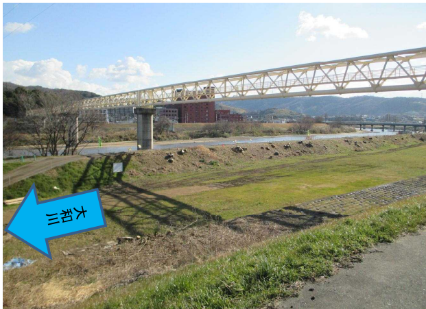
No. 2 伐採後 大和川左岸18.8km _____ _____ _____ _____ _____ _____ 撮影日:2015年2月13日