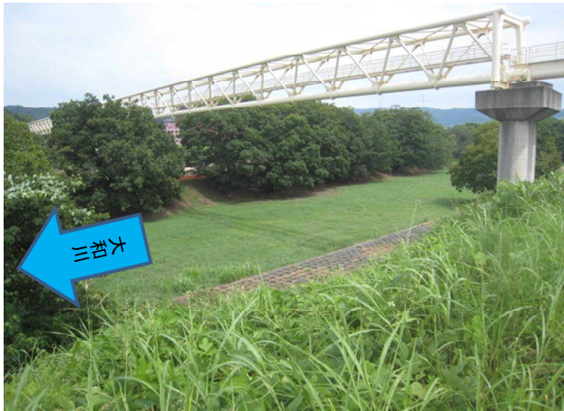
No. 1 伐採前 大和川左岸18.8km _____ _____ _____ _____ _____ _____ 撮影日:2014年8月13日