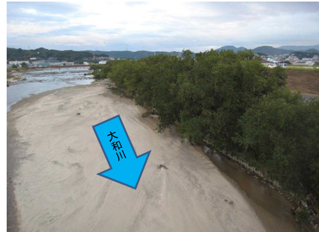
No. 3 伐採前 大和川左岸17.2km _____ _____ _____ _____ _____ _____ 撮影日:2014年11月5日