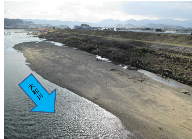
No. 4 伐採後 大和川左岸17.2km _____ _____ _____ _____ _____ _____ 撮影日:2015年2月9日