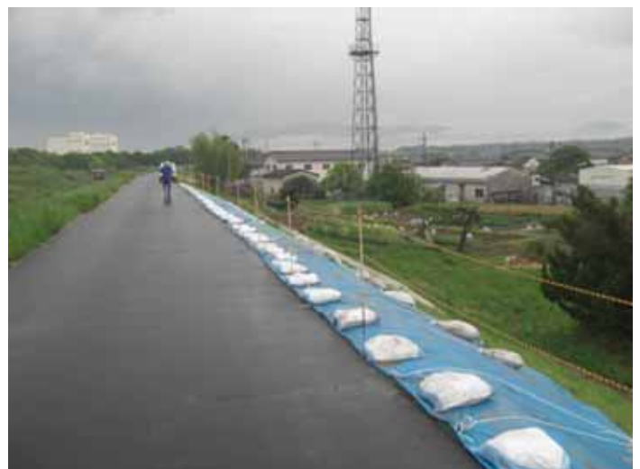
ブルーシートによる法面保護