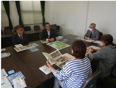
大和川の特徴説明