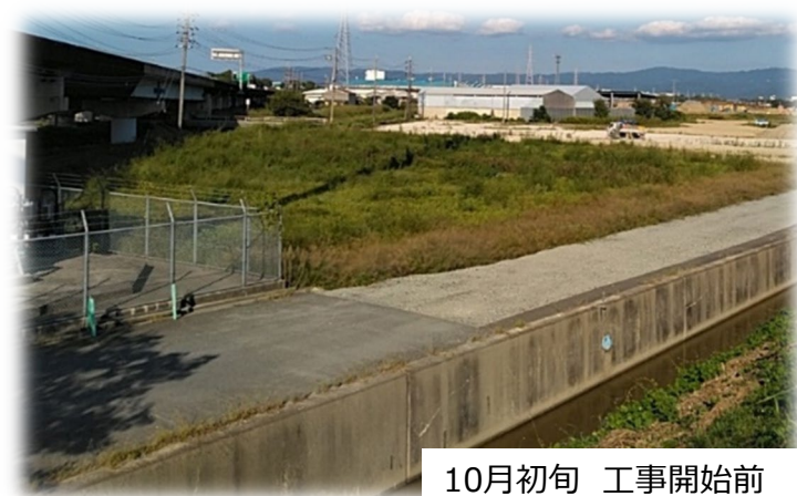
10月初旬 工事開始前