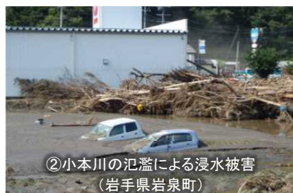
【平成28年8月台風第10号】