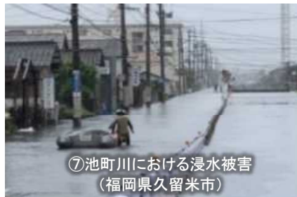
【令和3年8月からの大雨】