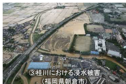
【平成29年7月九州北部豪雨】