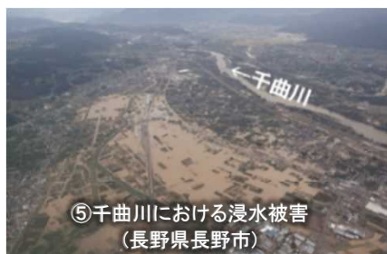
【令和元年東日本台風】