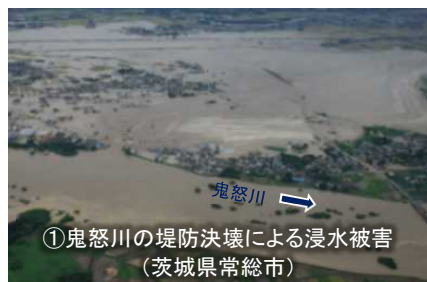
【平成27年9月関東・東北豪雨】