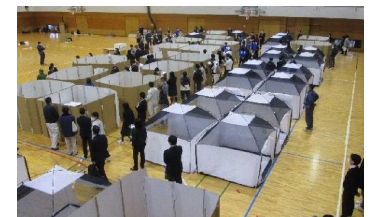
感染症対策をした避難所運営演習(柏原市)