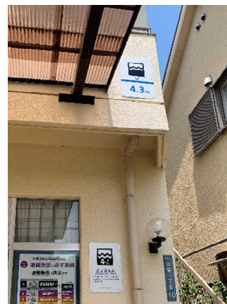
まるごとまちごとハザードマップ表示板の設置(藤井寺市)