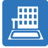
雨水貯留浸透施設