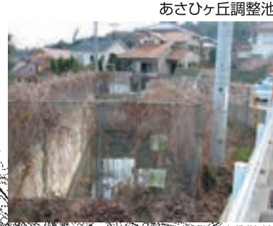
あさひヶ丘調整池