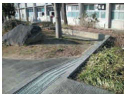
明日香村立聖徳中学校