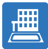
雨水貯留浸透施設