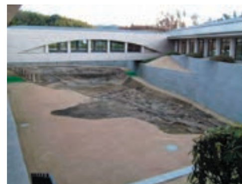
奈良県立万葉文化会館