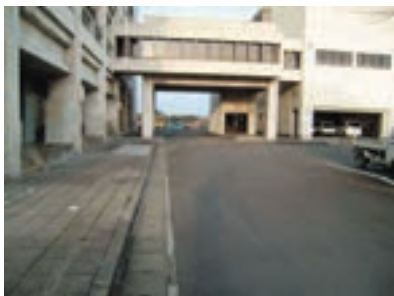
第二浄化センター