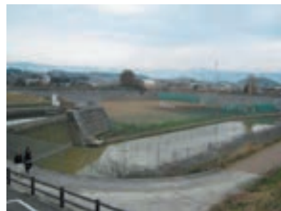
不毛田川流域調節池