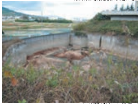
御所市小殿地区工業団地