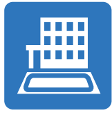
雨水貯留浸透施設