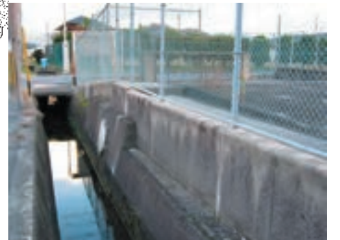
奈良県立御所実業高等学校