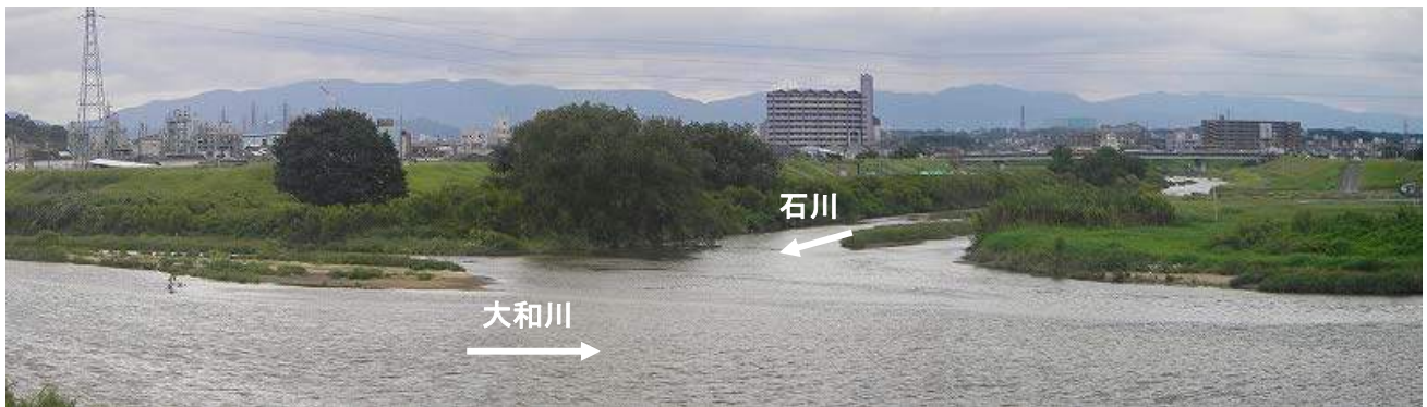
石川合流点付近の様子

河川管理者からセイタカヨシの群生状況（位置、種類、面積等）について説明がありました。