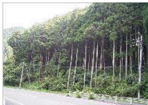
初瀬ダム上流部における植生の状況