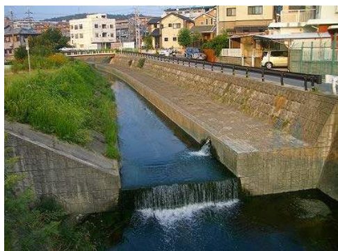
東生駒川総合浄化施設