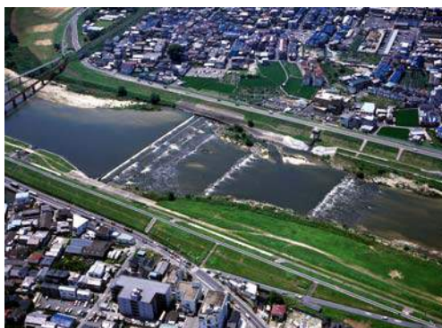
柏原地区 瀬と淵浄化施設

河川管理者から、瀬と淵浄化施設の目的、機能、水質測定結果から見た浄化効果、生物調査結果、および柏原堰堤の設置目的、魚道の概要、堰堤周辺の河床低下の状況、取水状況について説明がありました。