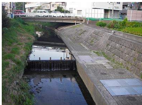
東生駒川総合浄化施設