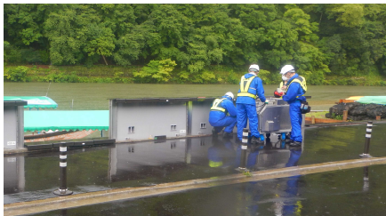
油圧シリンダーによる押し上げ操作 (操作は京都市が実施)