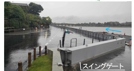
現地状況 ( Swing Gate)