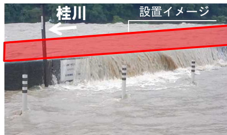
H30年7月豪雨による浸水

平成29、30年では嵐山において浸水被害が発生しましたが、可動式止水壁があれば、 浸水被害を回避 することが可能です。 ※右写真は可動式止水壁設置時のイメージです。