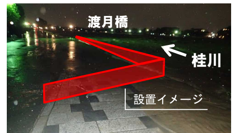
H29年10月台風21号による浸水