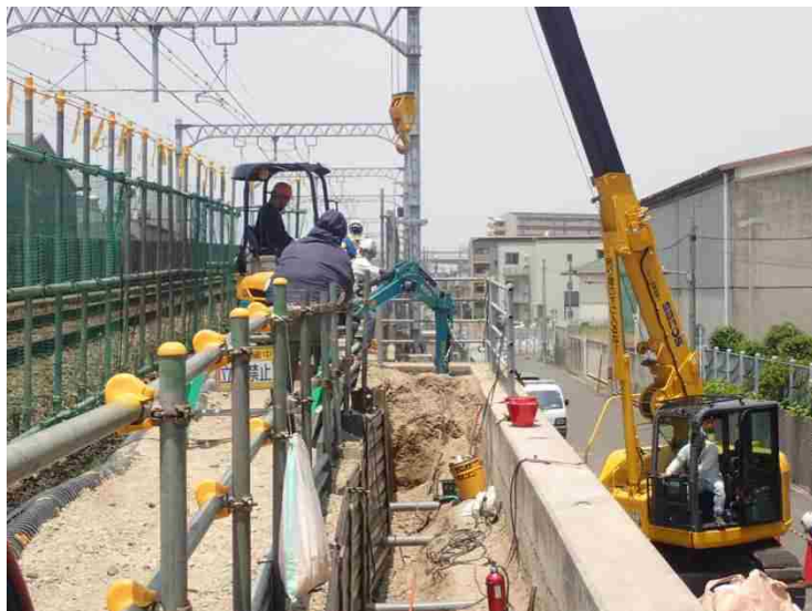
①仮線構築工（土留杭背面掘削～土留板）