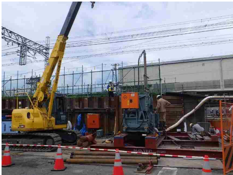
①仮線構築工（基礎杭工）