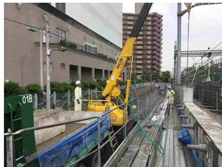
②仮線構築工（既設擁壁切断撤去）