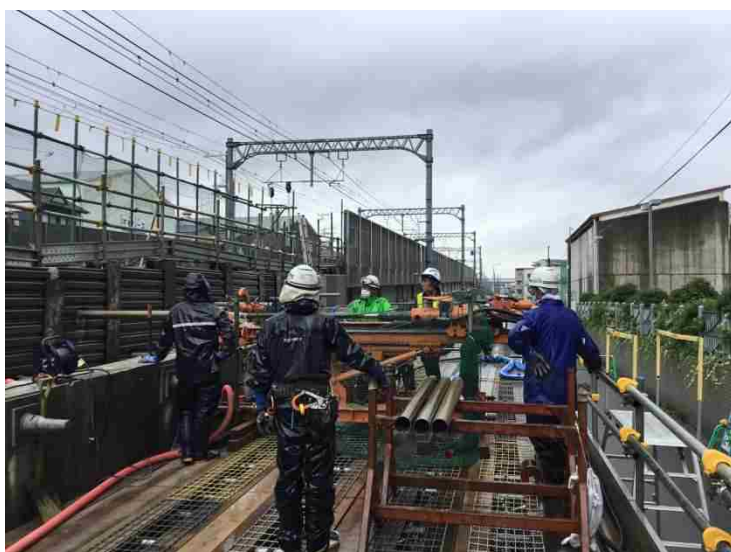
③仮線構築工（タイロッド工）