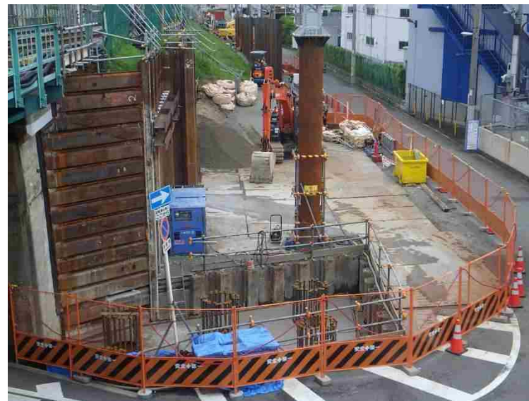
②仮線構築工（躯体工）