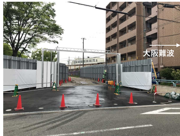
②工事ヤード整備工