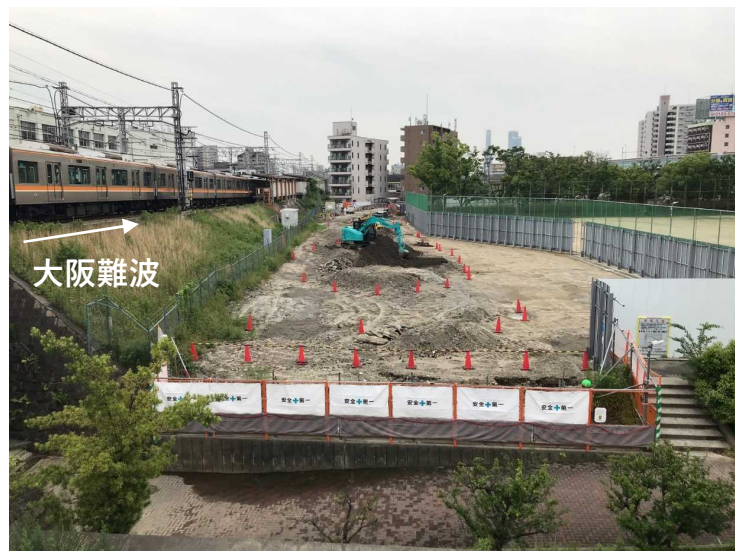
①工事ヤード整備工