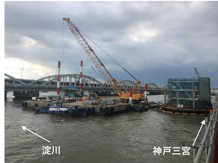
②鋼管矢板井筒基礎工