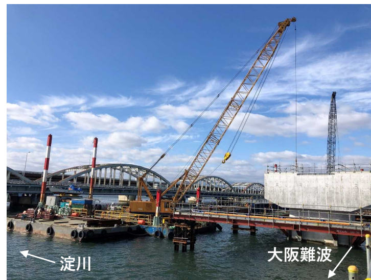
②鋼管矢板井筒基礎工（躯体構築）