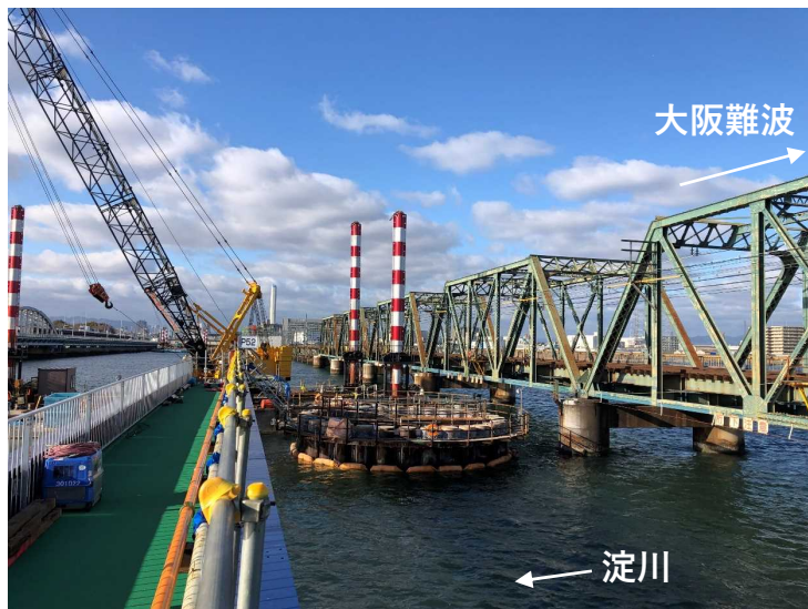
①鋼管矢板井筒基礎工（鋼管内コンクリート）