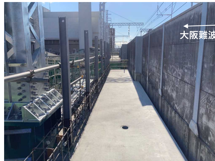
②仮線構築工（床版構築工）