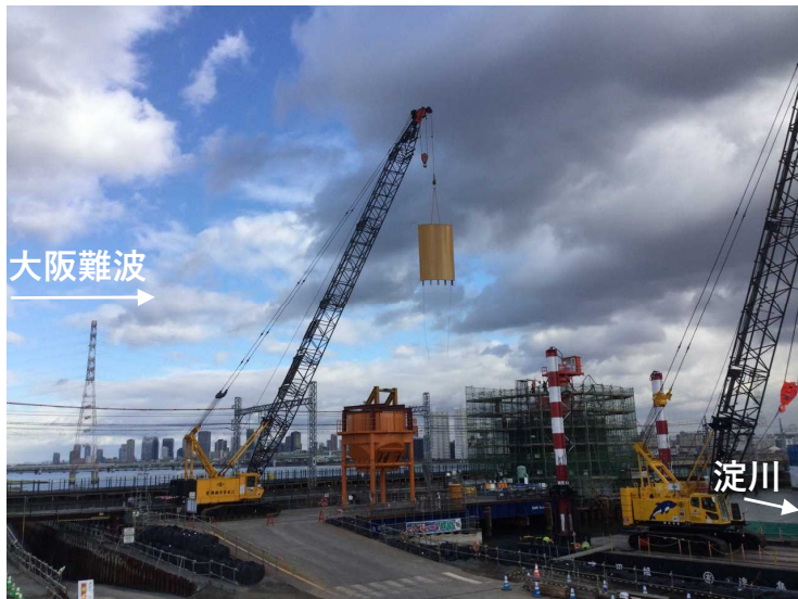
①ニューマチックケーソン基礎工（側壁構築）