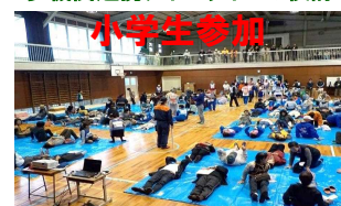
避難所解説訓練の実施