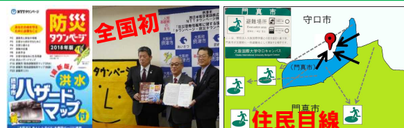
ハザードマップ周知の工夫