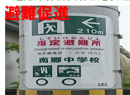
まるごとまちごとHMの設置