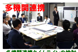
多機関連携タイムラインの検討