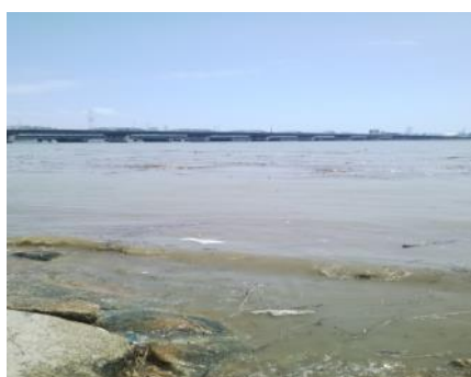
川面を流れる浮遊物