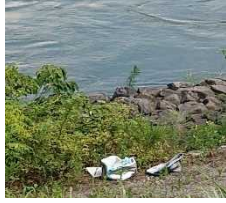
空き缶の放棄が二ヶ所発見。