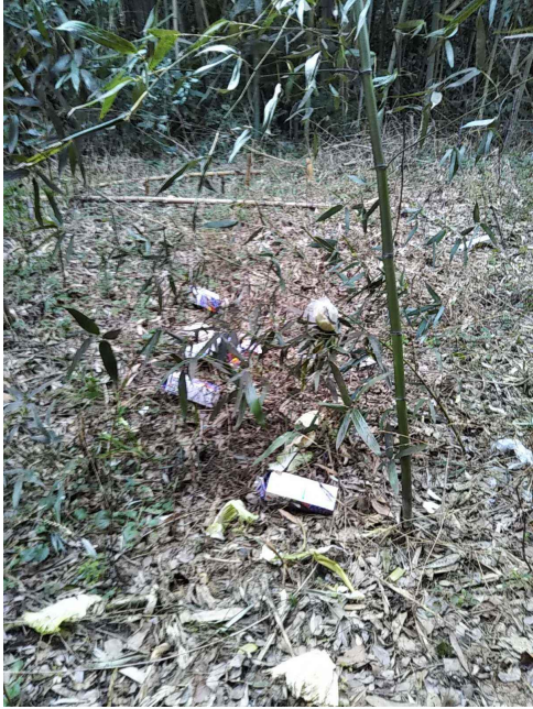
橋の下でゴルフのパター練習をしている男性がいました。 河原にもゴミがありました。