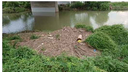
↑西大橋下の漂流ゴミの滞留

高架下に空き缶や大型ゴミ類が大量にまとめて置いてありました。 最初はゴミ捨て場なのかと思いましたが、猫と中年男性のお住まいになっているようです。 雨が続けていますので、橋下で暮らすのは大変危険かと思えます。 トラブルにならないか心配です。