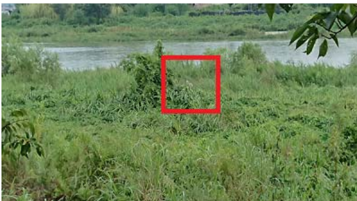
↑ 梅津排水樋門付近

野球場から上野橋までの河川の整備はほとんどされていない様子で、歩道が徐々に細くなり上野橋まで通れませんでした。歩道の行き止まりで野犬を見かけたので報告します。