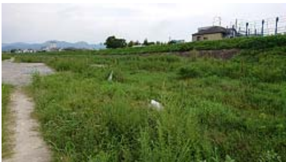
←上野橋から約800mの河川敷歩道のロープ破損