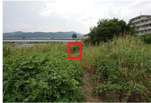
↑ 青い自転車の不法投棄