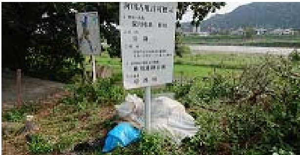
←松尾橋から左岸側3m付近のゴミ

橋から少し離れたところに草でほとんど見えませんが、「バーベキュー禁止」や「音の出る花火禁止」と書いた看板を見つけました。