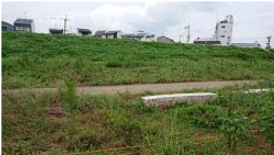
←上野橋から約600mの歩道のベンチに落書き