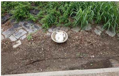
↑西大橋下の堤防沿いに不法投棄の電球等