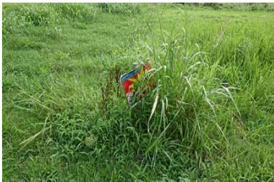
↑松尾橋から左岸50m付近のバーベキュー禁止看板

橋から少し離れたところに草でほとんど見えませんが、「バーベキュー禁止」や「音の出る花火禁止」と書いた看板を見つけました。