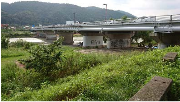
←橋下の落書きとバーベキューをしている人々