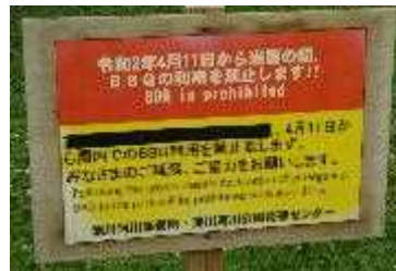
淀川河川公園管理センター