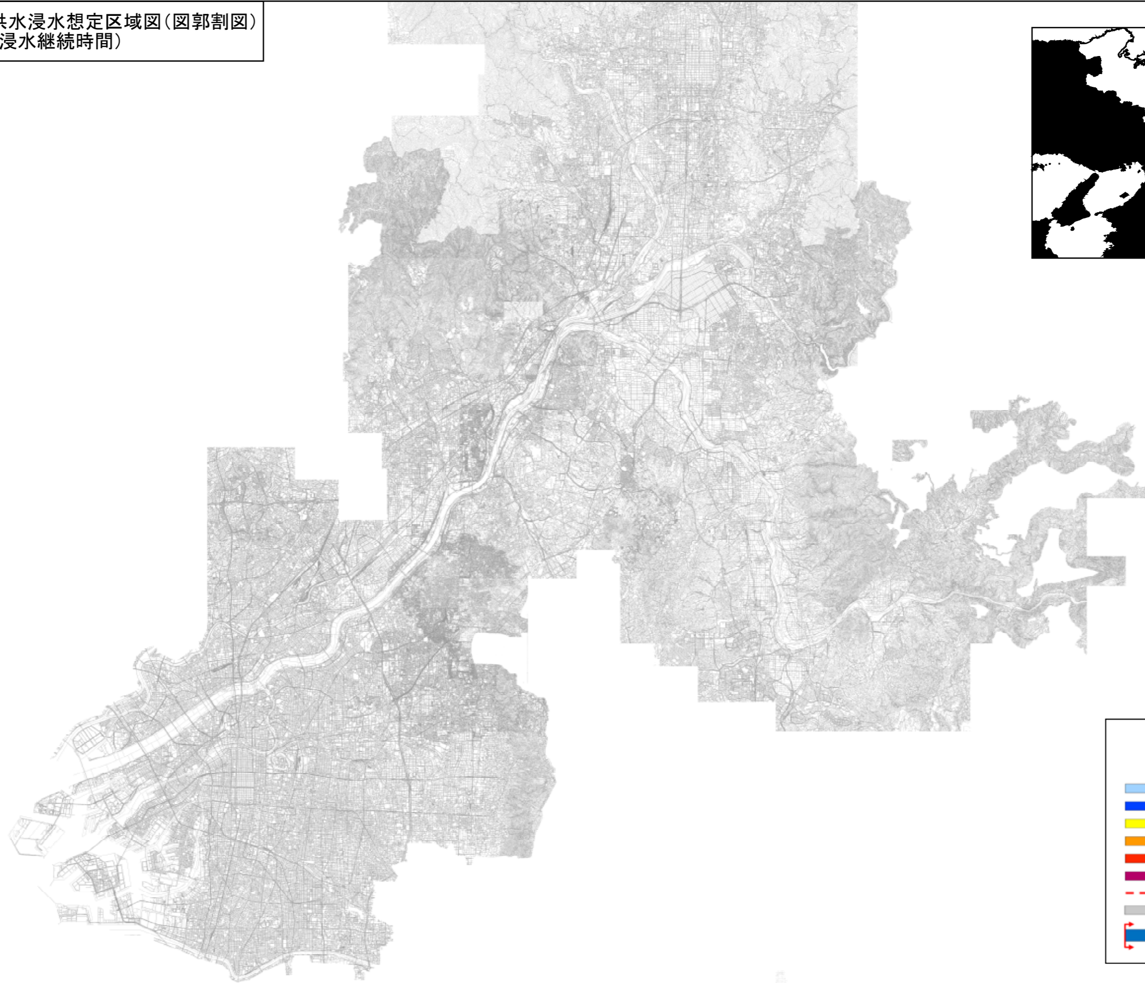
淀川水系木津川洪水浸水想定区域図(図郭割図) (浸水継続時間)