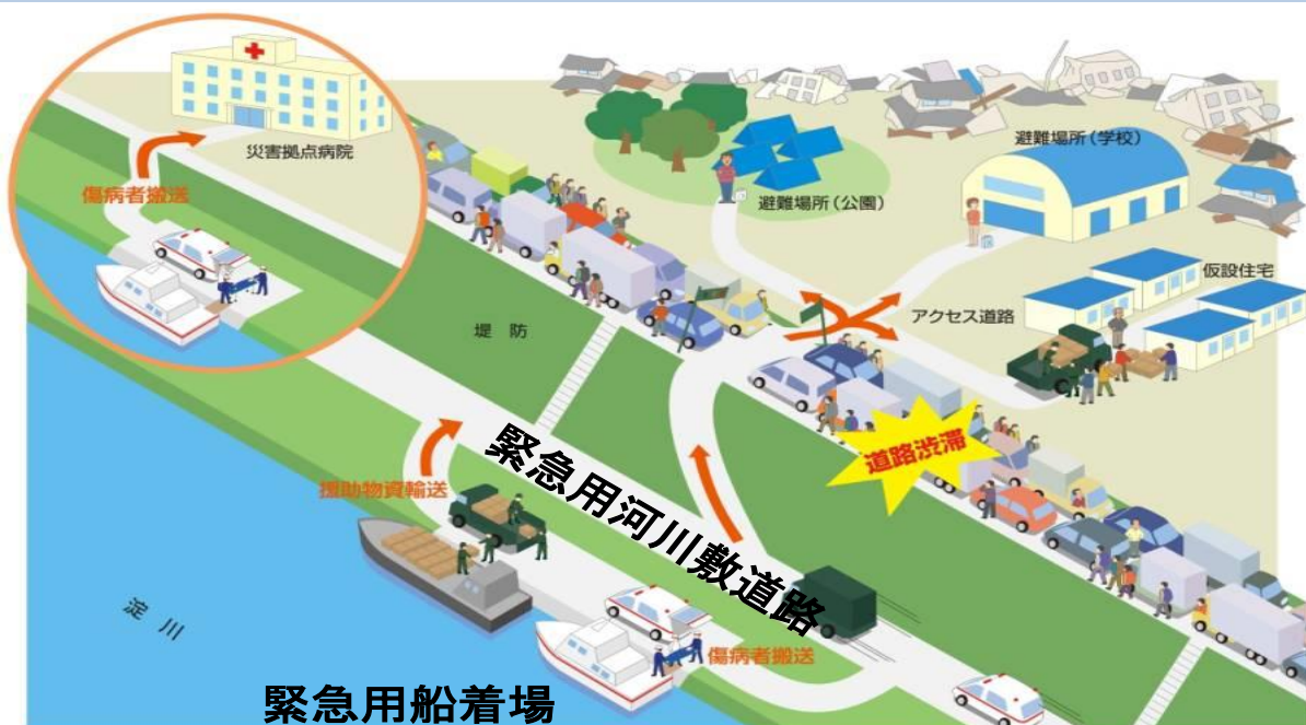
佐太船着場を利用した災害訓練 (守口市)