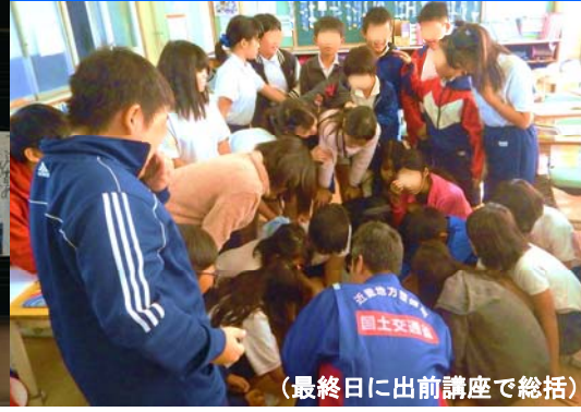
(最終日に出前講座で総括)