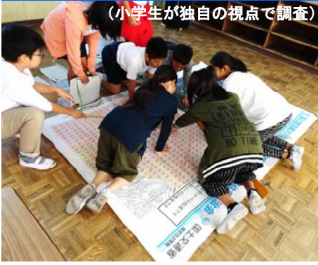
(小学生が独自の視点で調査)