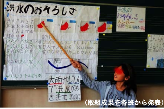
(取組成果を各班から発表)