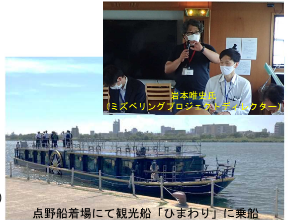
点野船着場にて観光船「ひまわり」に乗船