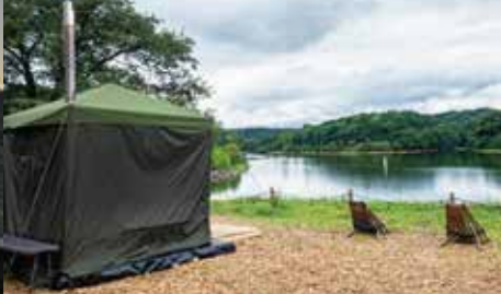
※手ぶらでキャンプを楽しめるレンタルもあります