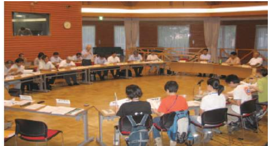
有馬富士公園運営・計画協議会の様子

住民代表（公募） 兵庫県立人と自然の博物館 学識経験者 (財)兵庫県園芸・公園協会 兵庫県 兵庫県教育委員会 三田市 三田市教育委員会