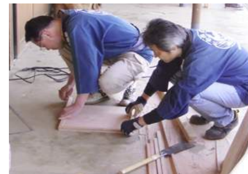
案内板などの施設製作