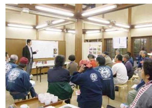
勉強会「こもれび講話」