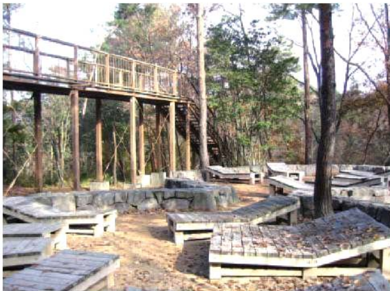
林の生態園・スカイデッキ