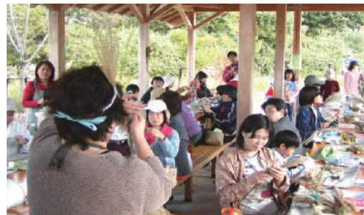
スキを使ったクラフト教室

問合せ・申込先:有馬富士公園運営・計画協議会 事務局 TEL 079-562-3040(パークセンター内)