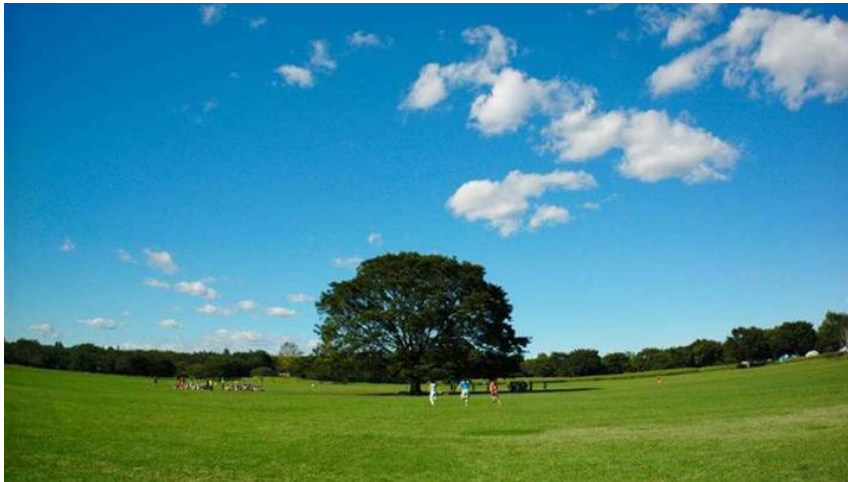
みんなの原っぱのシンボルツリー