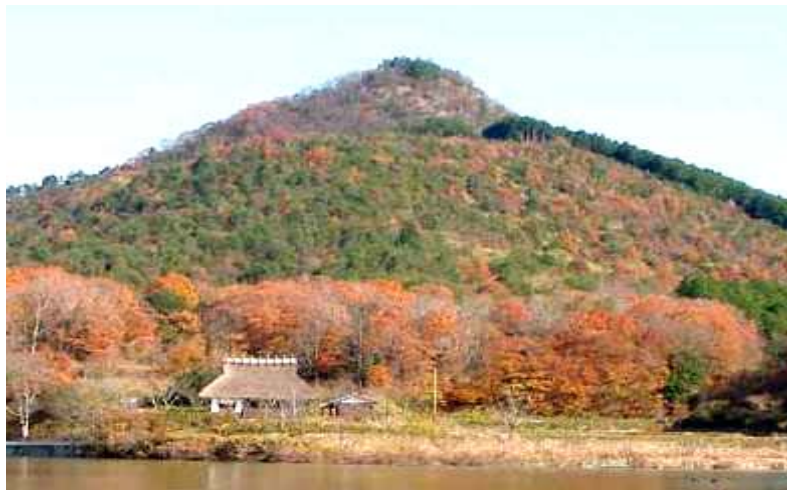
有馬富士とかやぶき民家