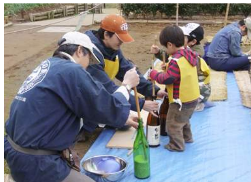
米つき・縄なえ体験