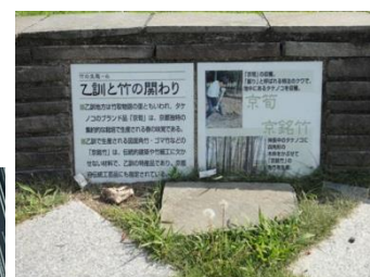
竹に関する情報板