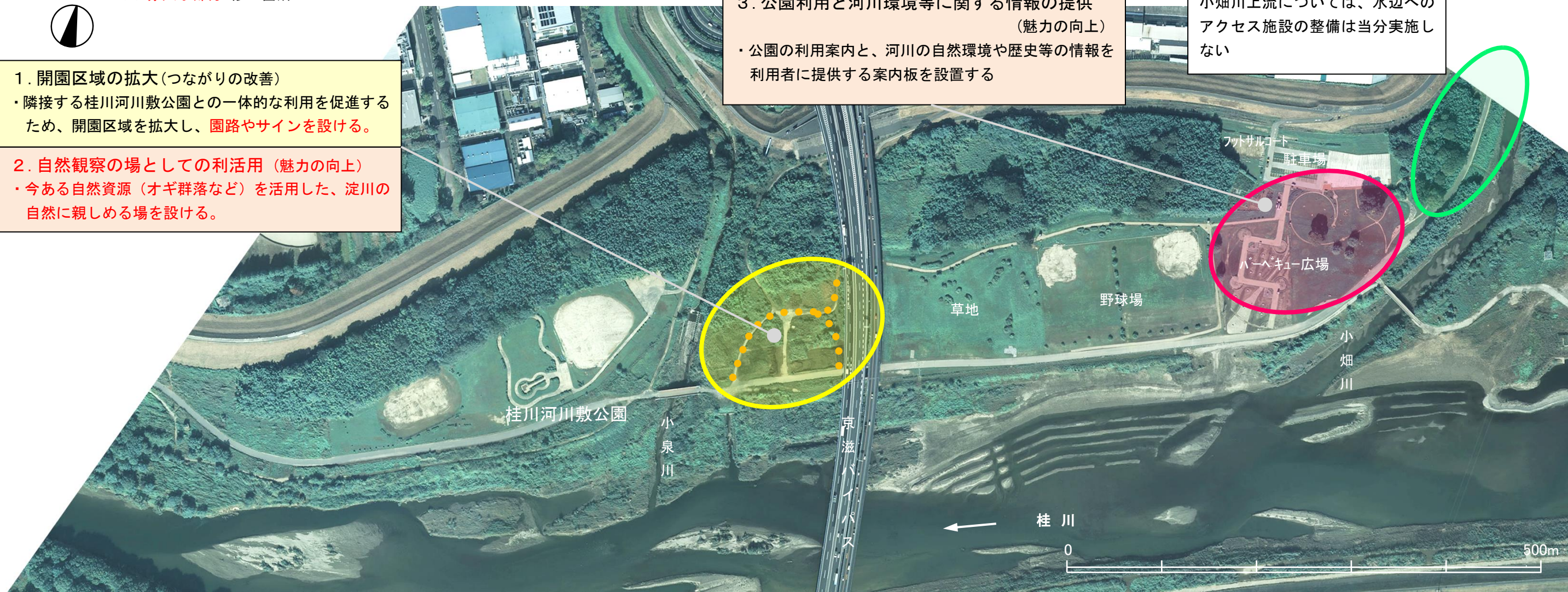
平成 25 年 8 月撮影