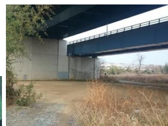
京滋バイパス高架下