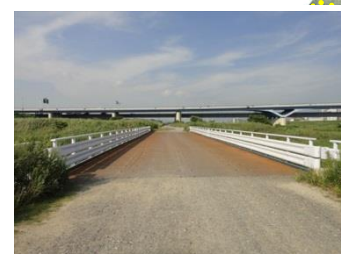
緊急河川敷道路連絡橋