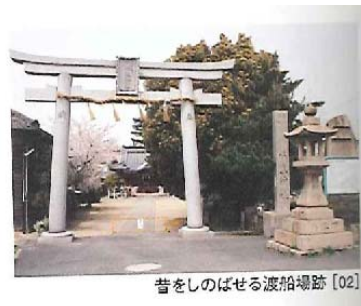
昔をしのばせる渡船場跡 [02]