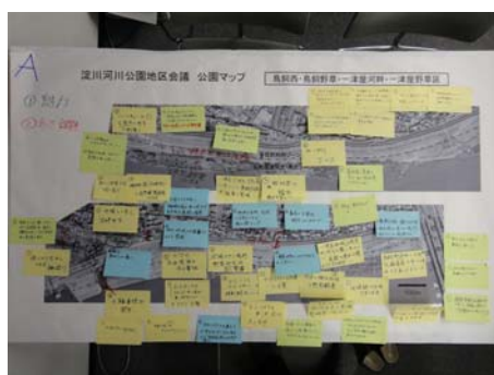
Aグループの意見交換の結果

鳥飼西・鳥飼野草・一津屋河畔・一津屋野草地区 地区会議では参加者の皆様から多くのご意見をいただきました。すべてのご意見について事務局で対応を検討し、次回の中流右岸地域協議会に報告します。