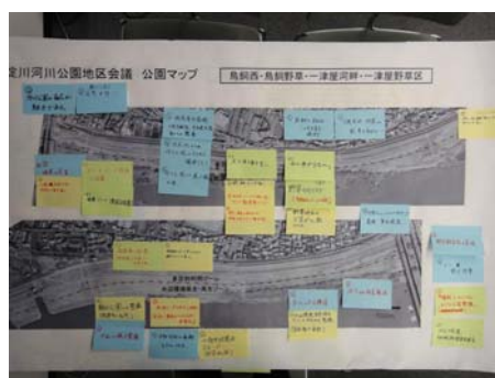
Bグループの意見交換の結果