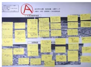
Aグループの意見交換の結果

木屋元・太間・点野野草・仁和寺野草地区 地区会議では参加者の皆様から多くのご意見をいただきました。すべてのご意見について事務局で対応を検討し、次回の上流域地域協議会に報告します。