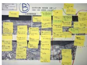
Bグループの意見交換の結果