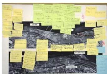
Aグループの意見交換の結果

枚方・三矢・伊加賀野草・出口河畔・出口・出口野草地区 地区会議では参加者の皆様から多くのご意見をいただきました。すべてのご意見について事務局で対応を検討し、次回の上流域地域協議会に報告します。