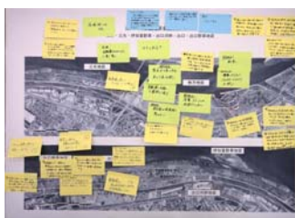
Bグループの意見交換の結果