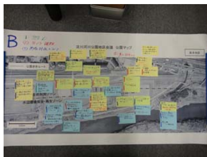
Bグループの意見交換の結果