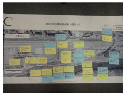
Cグループの意見交換の結果