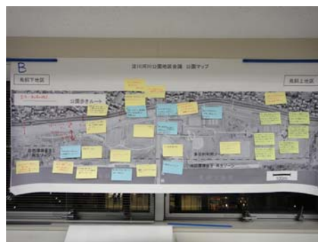
Bグループの意見交換の結果