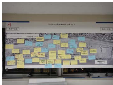
Aグループの意見交換の結果

鳥飼上・鳥飼下地区 地区会議では参加者の皆様から多くのご意見をいただきました。すべてのご意見について事務局で対応を検討し、次回の中流右岸地域協議会に報告します。