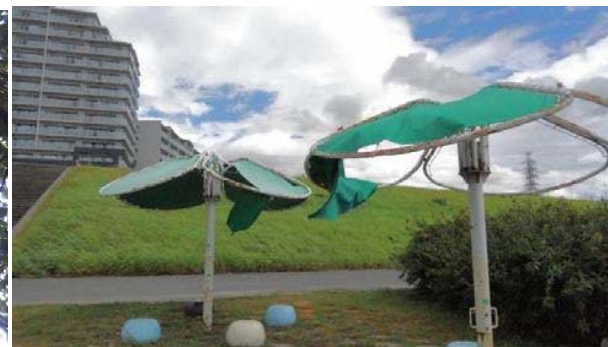
大塚地区：シェルター屋根部分テント地 破損