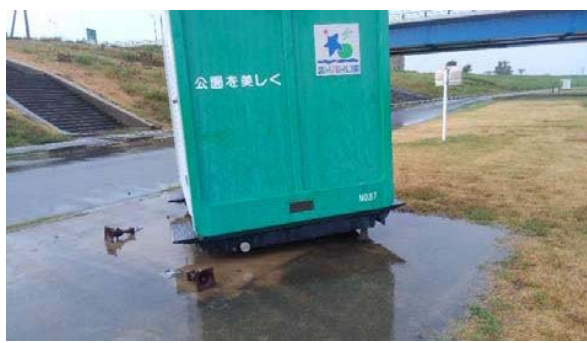
太間地区：トイレ2棟が移動