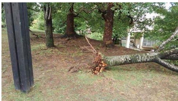
庭窪河畔地区：倒木(桜1本)