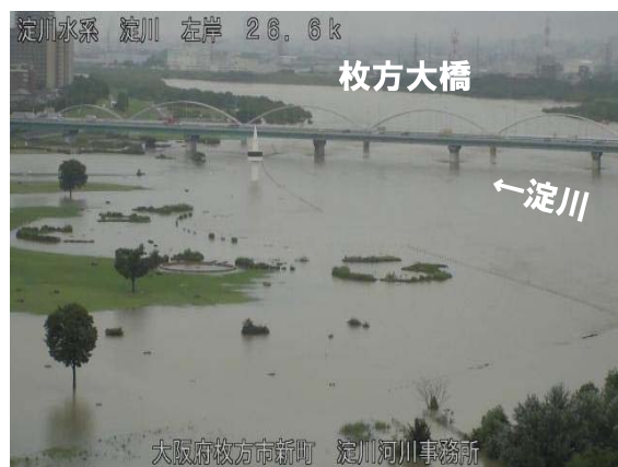
枚方地区の冠水時の状況 平成30年7月6日 16時00分