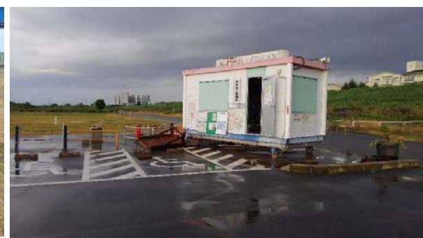
島本地区：管理所が2m程度移動し 台座から外れる