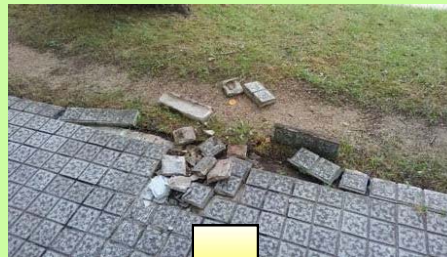
背割堤地区:園路のタイル破損