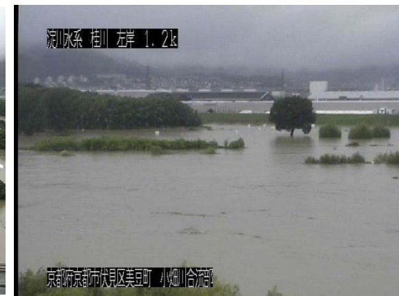
大山崎地区の冠水時の状況 平成30年7月6日 16時00分