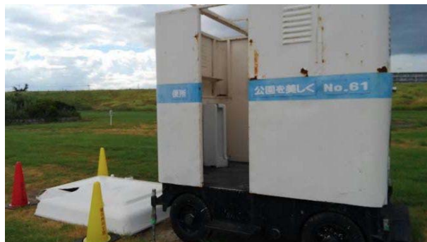
鳥飼上：トイレ屋根が飛散