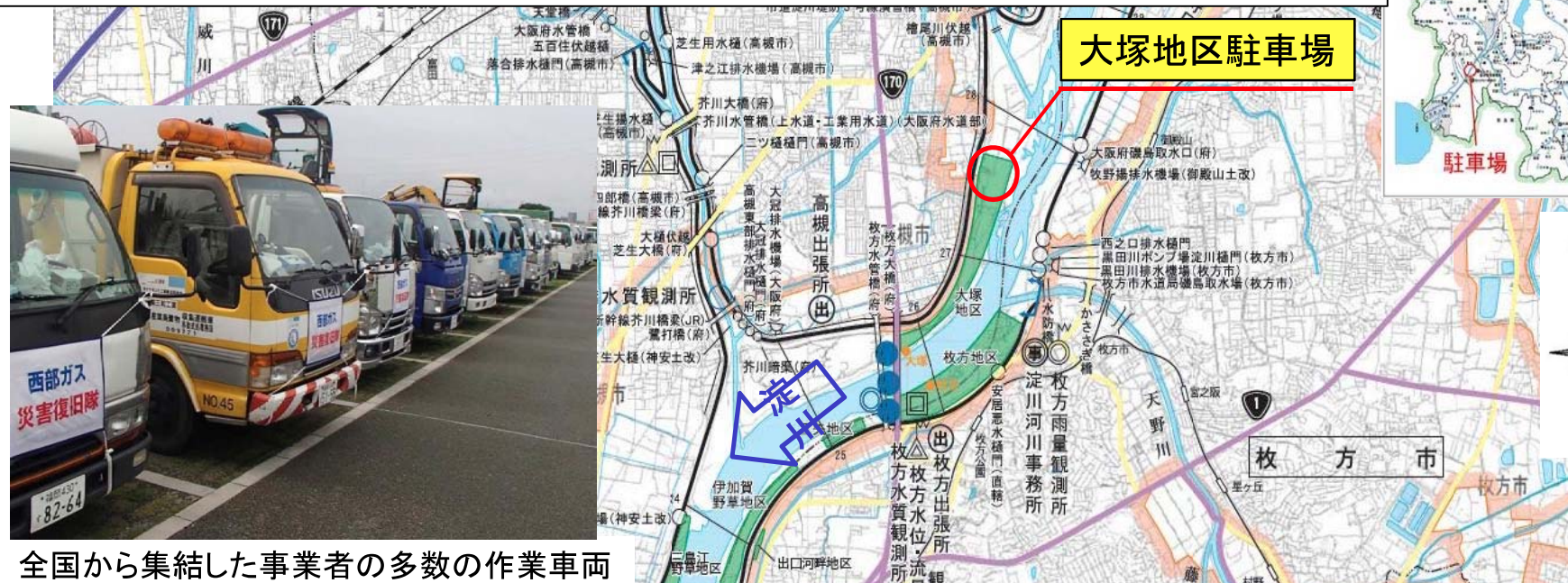
全国から集結した事業者の多数の作業車両