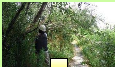
枚方地区:倒木処理