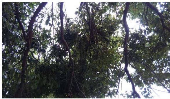
出口河畔地区：樹木(クス)の枝折れ