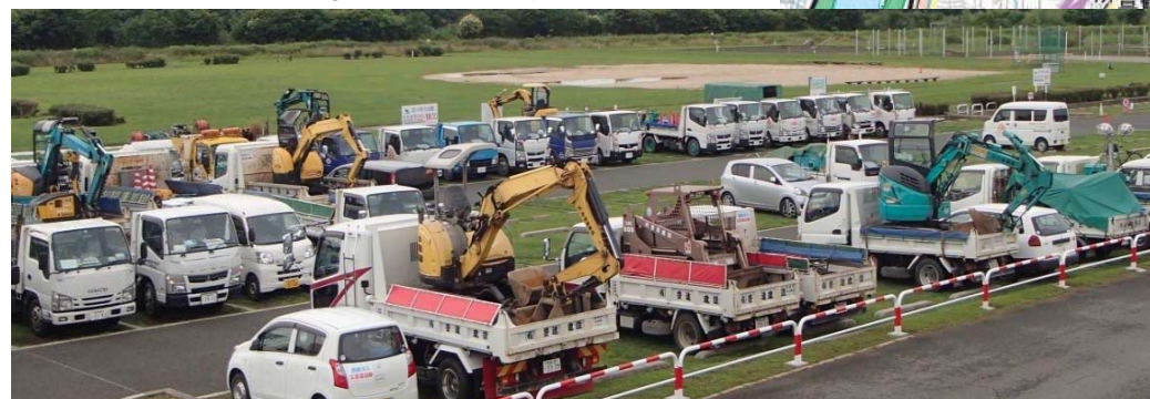
淀川河川公園駐車場における作業車両の駐車状況