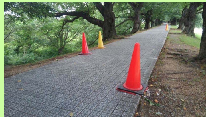
背割堤地区:コーン設置後全景