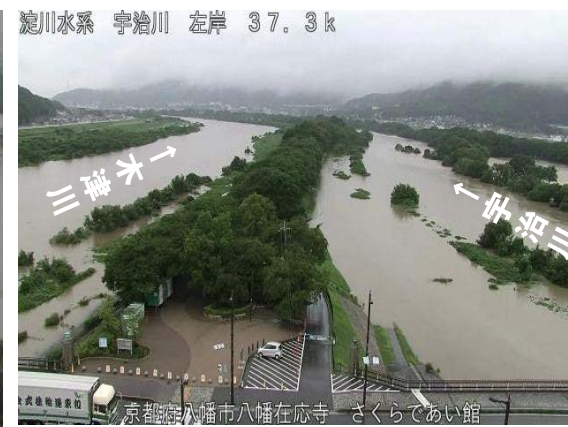
背割堤地区の冠水時の状況 平成30年7月6日 16時00分