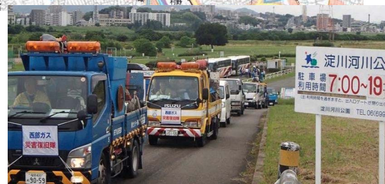
駐車場から復旧現場へ向かう車列