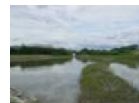
水際の再生を試行した箇所 (三島江地区)