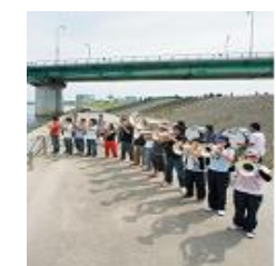
市民マーチングバンドの 練習風景