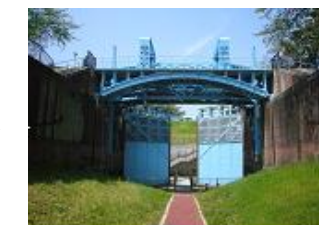
(淀川の歴史：旧毛馬第一閘門)

渡しや舟運、旧毛馬閘門、三川合流部など、淀川にまつわる歴史・文化に関する資源を活かします。