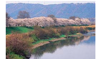
(淀川らしい水辺の景観)