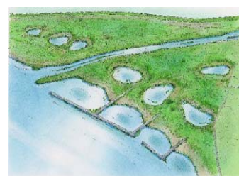
(ワンド、たまりの整備イメージ)