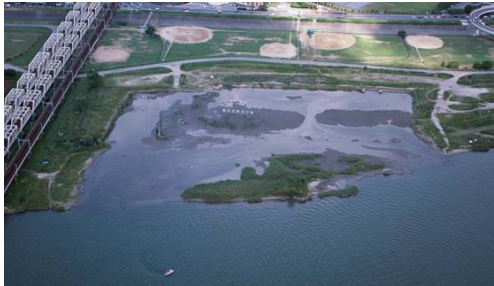
写真3 再生された柴島干潟

地域で生活し、コミュニティを形成している住民や地域外の淀川に価値を見出すただの市民の参画なくして淀川の川づくりはあり得ない。活き活きとした川づくりには「ただの住民、ただの市民の参画」が必要である。