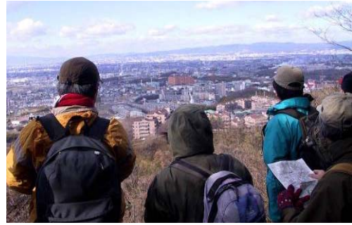
写真-7 源流ハイキング・間伐

これらの活動はワークショップと両輪で寝屋川再生の気運を高め、現在も継続している。