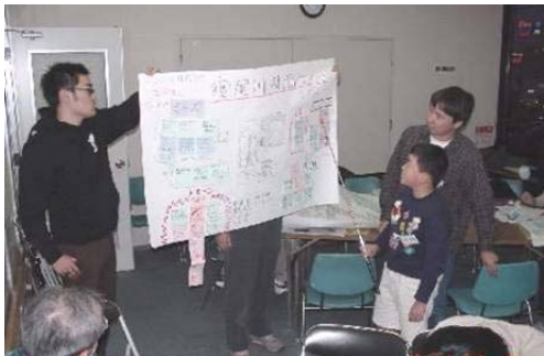
写真-6 ワークショップでの発表