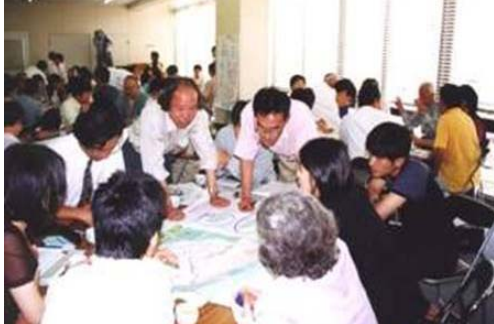
写真-5 ワークショップでの議論

寝屋川市は、ワークショップ委員を公募し、30名の定員に対して応募のあった61名全員を委員に委嘱した。多様な主体の参画を得るためであった。委員は小学生から高齢者までの「ただの市民」を中心として、土木や環境の専門家、ボランティア活動や環境の市民活動を進めようとする人たち、地域の青年会議所の会員などであった。公募委員のみによる前代未聞のワークショップの発足である。ワークショップは、1年間の議論を経て、「全体整備計画」、「重点整備箇所」、整備における「市民の果たす役割」等からなる「寝屋川再生プラン」を策定し、提案した。市民主体による初めての「かわまちづくり」計画の誕生であった。