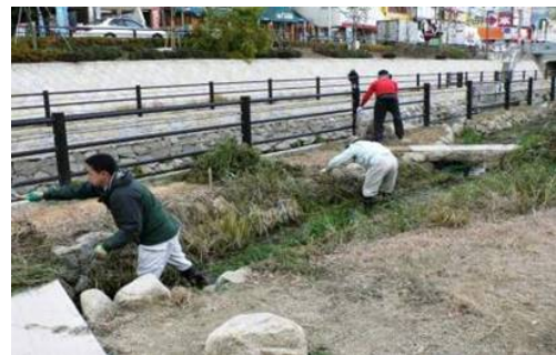
写真-12 市民による維持管理（除草）

また、この水辺空間を活用する取り組みも注目である。ここに整備した船着場から天満橋・八軒家跡まで、公募した130名もの市民でEボートなどを連ねた「野崎くだり」と称する川下りを催したり、生物調査や観察会を定期的に行っている。さらに、特筆すべきこととして、水辺クラブは、水辺空間が有する癒しの効果を生かし、医療機関と連携して統合失調症患者等を対象とした社会復帰ケアプランの一環をなす取り組みも行っている。また、当初から水辺空間の実現に関わった青年会議所をはじめ、商業団体の連合会などは、毎年、手を替え品を替え、この水辺空間で様々な市民参画型の取り組みを行っている。