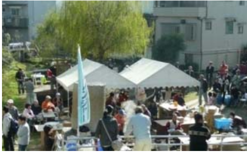
写真-14 市民による整備箇所の活用（茨田イチョウ祭り）

「自己決定がやる気を生む」。これが寝屋川の川づくりから得られた市民参画・協働の川づくりのキーワードである。