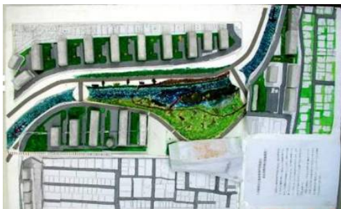
写真10 ワークショップで作成した模型

このように、ワークショップと水辺クラブ、そして地域住民が連携し行政と協働する活動は、行政が計画を策定して粛々と工事を進めるというこれまでの行政展開と異なり、まちづくりの受益者である市民自身が要望・要求を超えて、様々な段階に当事者として関わり、川づくり・まちづくりの納得度・満足度を高めていった。