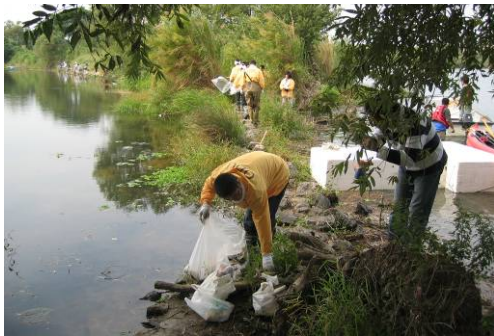
写真4 点野ワンドの清掃