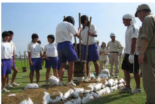
写真-2 水防工法の体験