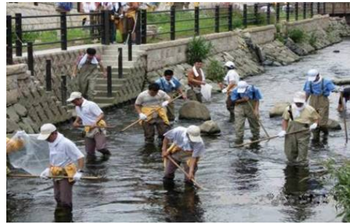
写真-8 クリーン作戦・胴長軍団