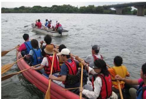
写真-1 Eボートに乗って淀川下りを体験