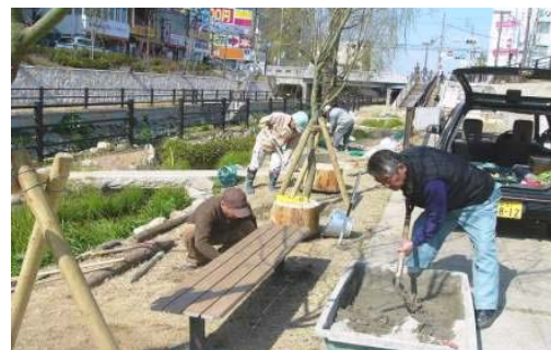
写真-13 市民による維持管理（施設の補修）

また、第3弾で整備した“茨田樋遺跡水辺公園”では、隣接する幹線水路での舟乗り体験や福祉委員会が花見を催すなど、地域コミュニティも活発化している。また、秋にはランドマークの銀杏の実など秋の実りを食べる「茨田イチョウ祭り」が催され、寝屋川や淀川の活動に関わる市民、市民団体、大学、行政と地域住民との交流が図られている。