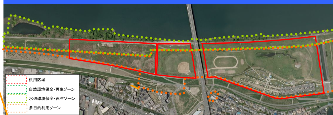
■ 淀川河川公園基本計画におけるゾーニング

ワンドの環境改善 (ゾーニング計画の実現) ・点野ワンドにおける環境改善のための植生管理の実施(伐木、外来種の除去等)