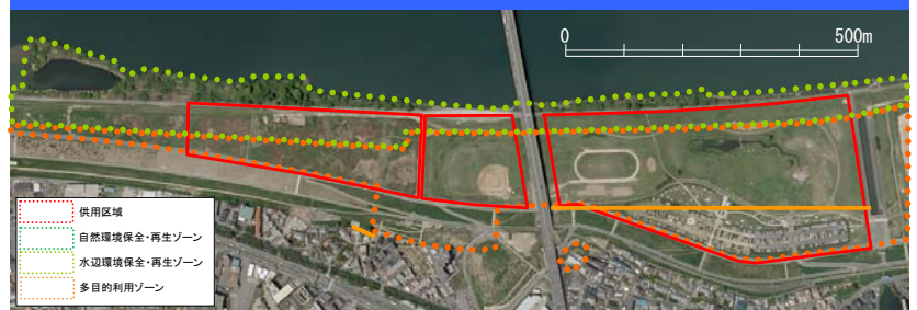
■ 淀川河川公園基本計画におけるゾーニング