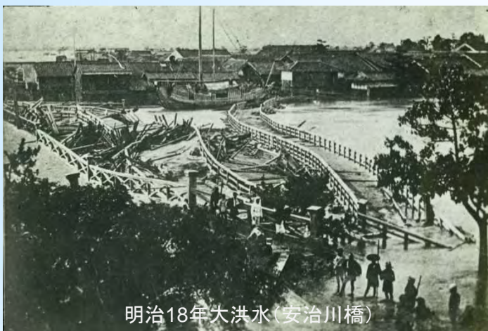
明治18年大洪水(安治川橋)