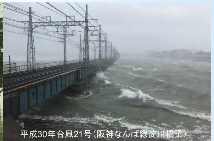
平成30年台風21号(阪神なんば線淀川橋梁)