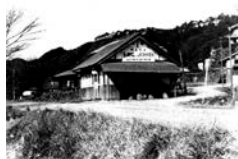
水没した石山外畑町の民家

天ヶ瀬ダム建設に伴い水没した大津市外畑地区を中心に南郷地区、大石地区の写真を展示