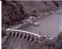
旧大峰ダムと乗船場

東側のパネルには流域の天ヶ瀬ダム建設当時の生活の情景やダムの建設状況の写真を展示しています。