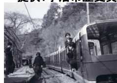
天ヶ瀬にあったおとぎ列車乗り場