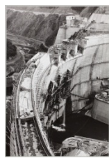
コンクリート打設中の状況