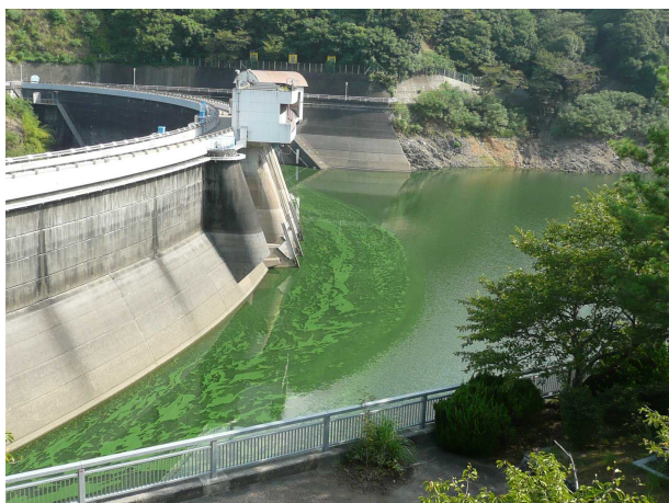
【②ダム湖と田原川合流点の状況】