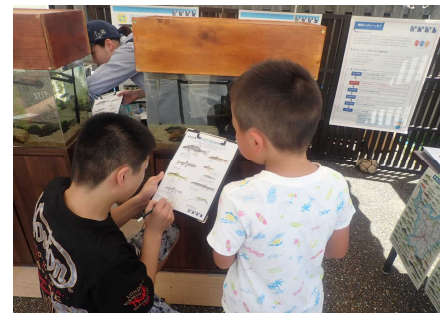
ワークショップのようす①