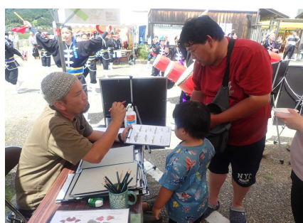
ワークショップのようす③