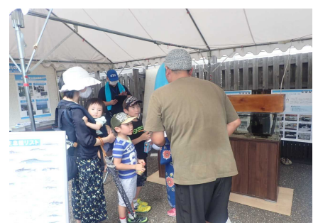
ワークショップのようす④