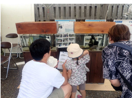
ワークショップのようす②