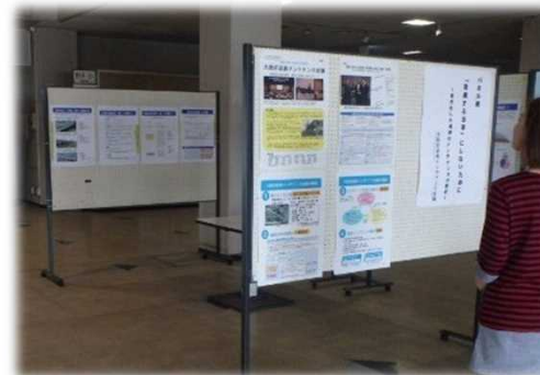
&lt;泉南府民センター&gt;