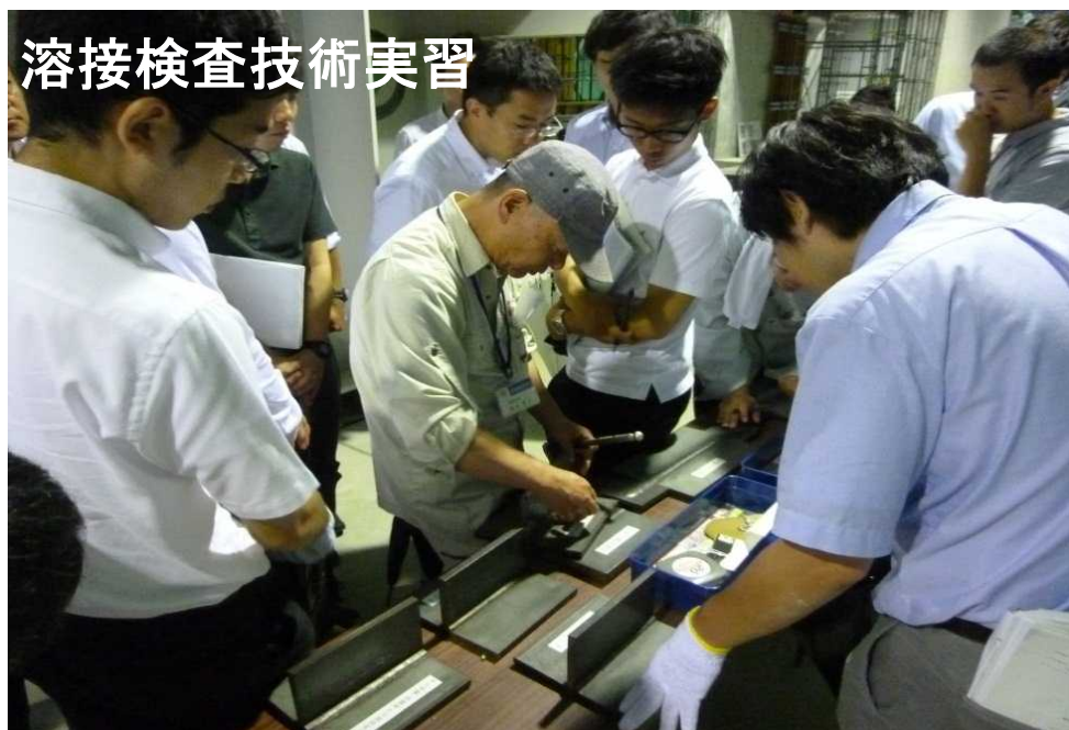
溶接検査技術実習