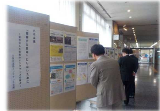
&lt;豊能府民センター&gt;