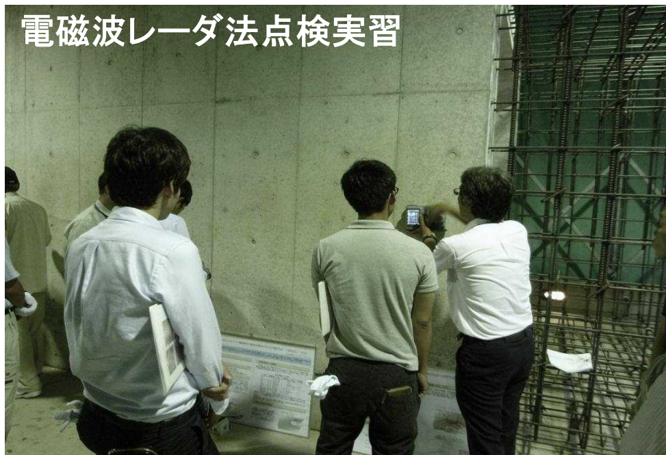
電磁波レーダ法点検実習