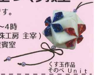
くす玉作品 そのべ Unit

日時：5月3日（火・祝）午後2時～4時 講師：兵律子氏（和紙あ〜と・久寿珠工房 主宰） 会場：越前市武生公会堂記念館 貴賓室 料金：500円（材料費として） 定員：10人（要申込・先着順）