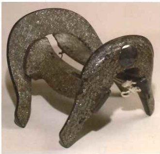
巴散文螺鈿鞍 （県指定） 大塩八幡宮蔵

本展では、伝統的工芸品をはじめ、市に残る秀逸な意匠の施された作品を一堂に集めて、その意匠に込められた意味や成り立ち、そして意匠を施した職人たちの高い技術をご紹介します。