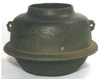
竹梅文真形釜 （市指定） 弘願寺蔵